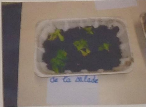
de la salade