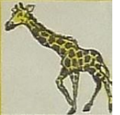
La girafe, c'est / girafe