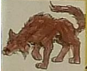
La louve, c'est / louve