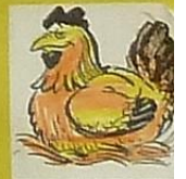
La poule, c'est / poussin