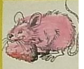
La souris, c'est / souris