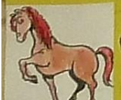
La jument, c'est / poulain