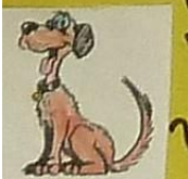
La chienne, c'est / chiot