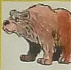
L'ourse, c'est / ourson