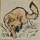
La renarde, c'est / renarde

Dessiner un animal sorti du ventre. poule?