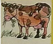
La vache, c'est / veau