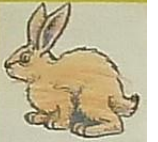
La lapine, c'est / lapereau