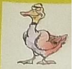
La cane, c'est / caneton